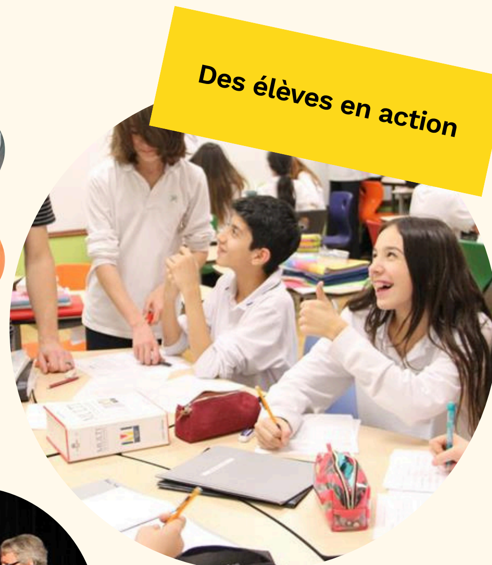
Des élèves en action