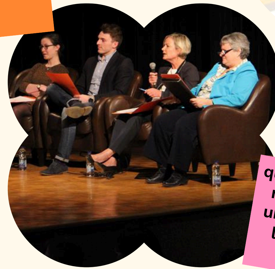
qui contribuent réellement à une cause qui leur tient à coeur !