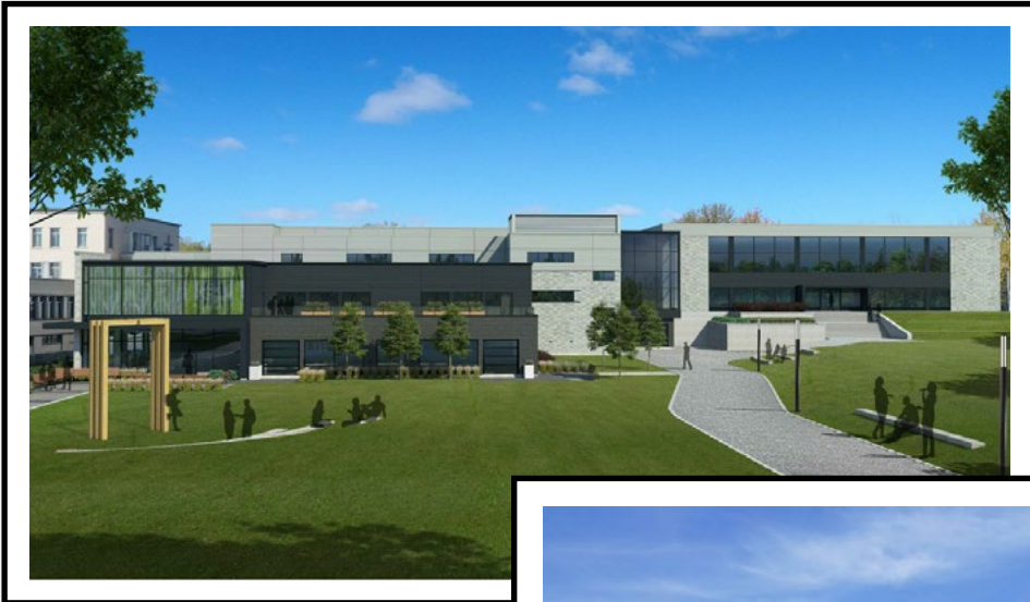
VISUEL D'ENSEMBLE DE L'AGRANDISSEMENT