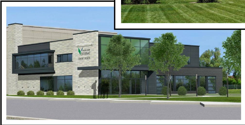
VISUEL RAPPROCHÉ DE LA PARTIE AVANT