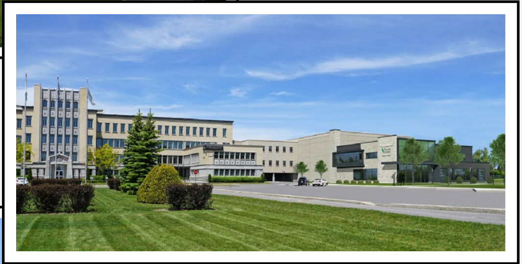
VISUEL À PARTIR DE L'AVANT DU COLLÈGE